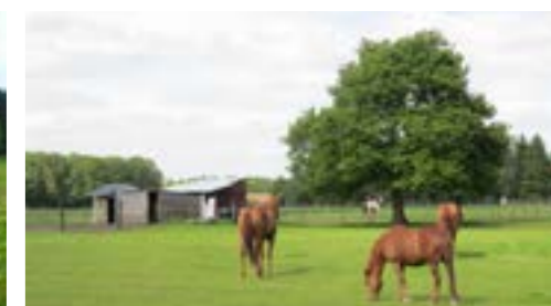
Schaduwboom in paardenweide