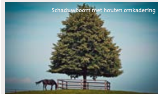
Schaduwboom met houten omkadering

-Door schaduwbomen, knotbomen, houtkanten en heggen te integreren zorg je voor beschutting tegen zon, regen en wind, geef je structuur aan het landschap en bezorg je andere faunasoorten voedsel- en schuilmogelijkheden.