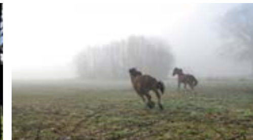
Ruimte om te bewegen