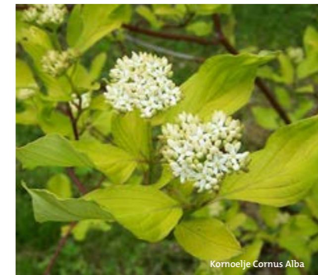
Kornoelje Cornus Alba