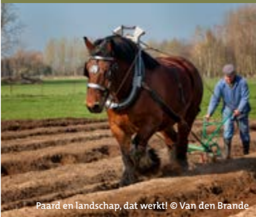
Paard en landschap, dat werkt! © Van den Brande

De toename van het aantal paardenhouders biedt heel wat kansen voor biodiversiteit, ecologisch herstel en vrijwaring van waardevolle landschappen. Door streekeigen kleine landschapselementen te integreren, paardenweides als kruidenrijke graslanden te beheren en landschapsvriendelijke materialen te gebruiken, bent u naast paardenhouder, ook landschapsbouwer!