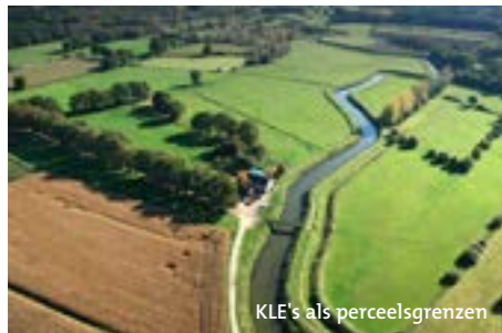
KLE's als perceelsgrenzen

In de provincie Antwerpen vind je verschillende streken. Bij elke streek hoort een landschapstype. Zo bestaat onze provincie uit boscomplexen, valleigebeden, open-, halfopen- en gesloten landschappen. Elk van deze landschapstypes is opgebouwd uit specifieke kleine landschapselementen (KLE's) zoals autochtone bomen, houtkanten, heggen, poelen, weiden en graslanden. Vroeger werden deze elementen gebruikt als perceelscheidingen, bron van gerief- of brandhout, oriëntatiepunten, veekering, extra schaduw en watervoorziening, maar ook vandaag bewijzen zij hun nut.