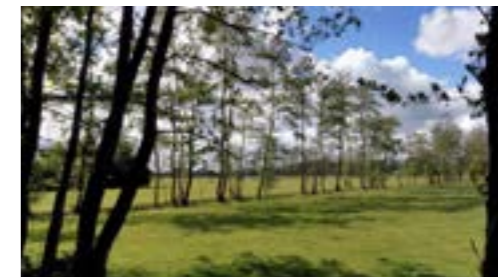
Dunne elzensingel rond weide