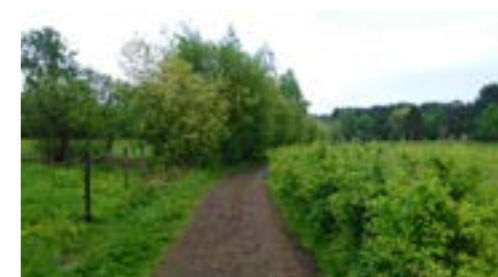
Meidoornhaag rond weide