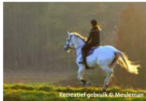
Recreatief gebruik

zijn dan ook duidelijk merkbaar. Er is een enorme toename van versnipperde percelen en het opduiken van schuilhokken, rijpistes, ruiterspaden, maneges, jumpingconstructies, lichtbakken en afrasteringen. Het veranderd landgebruik en het beheer van graasweiden heeft bovendien een niet te onderschatten impact op het landschap, de biodiversiteit, de waterhuishouding en de groenstructuren van onze provincie. Het is dan ook cruciaal deze landschappelijke transformatie op een verantwoorde manier in te passen binnen onze steeds schaarser wordende open ruimte.