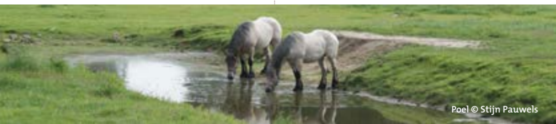
Poel © Stijn Pauwels