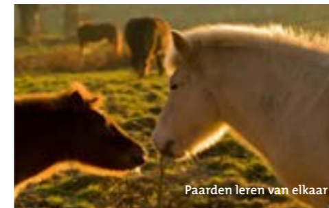
Paarden leren van elkaar

Paarden zijn kuddedieren die nood hebben aan gezelschap, beweging, voedsel en water . De weide is dé plaats bij uitstek waar paarden zich "thuis" voelen. Het is de natuurlijk biotoop van het gedomesticeerde paard. Paarden geven zelfs de voorkeur aan de relatieve vrijheid op de weide boven, het op het eerste zicht, hogere comfort in een stal of schuilhok.